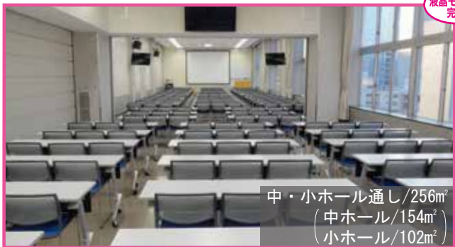
中・小ホール通し/256m 2 (中ホール/154m 2 ) (小ホール/102m 2 )